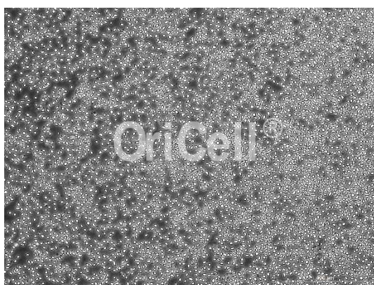
OriCell® JM1 细胞系在倒置相差显微镜下的形态

注意： 本产品在生产过程中严格控制无菌。后续培养请根据实际情况选择是否添加抗生素。