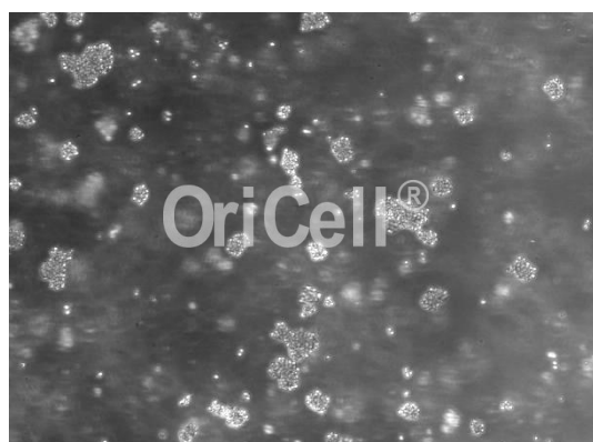
OriCell® OCI-LY7 细胞系在倒置相差显微镜下的形态

注意: 本产品在生产过程中严格控制无菌。后续培养请根据实际情况选择是否添加抗生素。