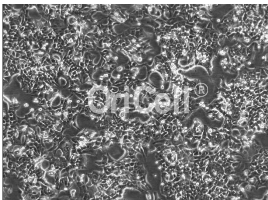
OriCell® HCC4006 细胞系在倒置相差显微镜下的形态