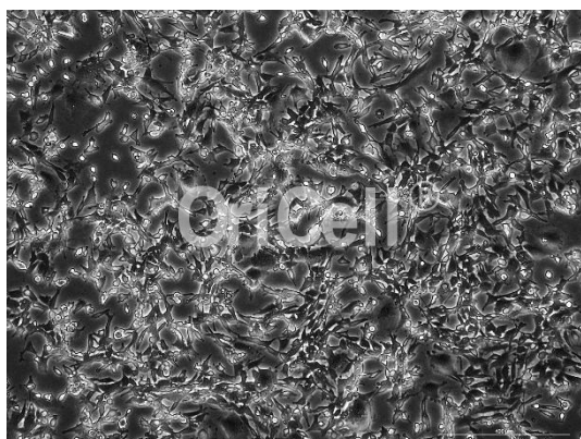
OriCell® 3T3-L1 细胞系在倒置相差显微镜下的形态

注意： 本产品在生产过程中严格控制无菌。在后续培养过程中，请根据实际情况决定是否在培养基中添加抗生素。