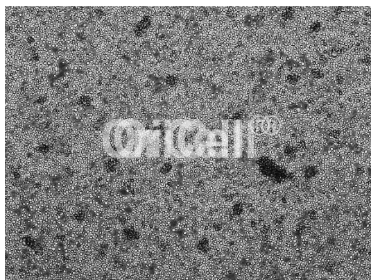
OriCell® P815 细胞系在倒置相差显微镜下的形态

注意: 本产品在生产过程中严格控制无菌。在后续培养过程中, 请根据实际情况决定是否在培养基中添加抗生素。